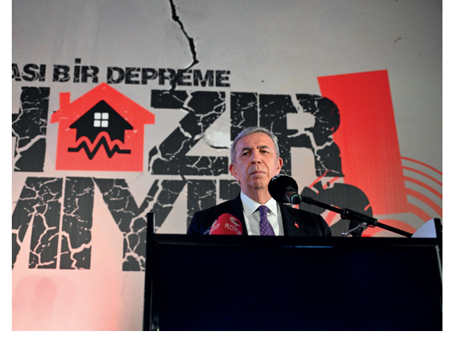
ABB BAŞKANI YAVAŞ: "DEPREM ÖLDÜRMEZ, BİNA ÖLDÜRÜR"

Cumhurbaşkanı Recep Tayyip Erdoğan engelli öğretmen adaylarına müjde vererek, "2025 yılında bin 381 engelli öğretmenimizin atamasını yapıyoruz." dedi.