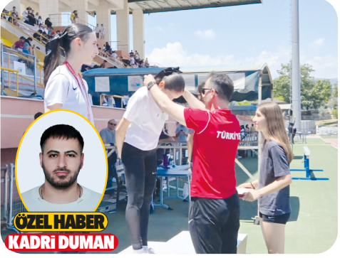
ÖZEL HABER KADRI DUMAN

Türkiye Sigorta Basketbol Süper Ligi'nde başarılı bir sezon geçirek play-off'a kalan temsilcimiz Mersin Spor Kulübü (MSK), güçlü rakibi Anadolu Efes'e 2-0 mağlup oldu. İstanbul'da oynanan serinin ilk maçında ortaya istediği gibi oyun koymayan MSK, rakibine 92-71 mağlup olmuştu. Serinin ikinci karşılaşması ise Mersin'de Servet Tazegül Spor Salonu'nda oynandı. Karşılaşmanın ilk yarısına kötü başlayan MSK 14 sayı fark yiyerek, devreyi 38-52 geride kapattı. İkinci yarıya ise iyi başlayan MSK, üçüncü periyotta rakibinden 9 sayı fazla atarak farkı 5'e indirdi: 23-14. Dördüncü periyot ise dengeli geçti. MSK ortaya koyduğu olağan üstü performansa rağmen güçlü rakibine karşı 84-81 kaybederek play-off'lara veda etti. Oynadığı oyun nedeniyle seyircisinin beğenisini kazanan MSK ayakta alkışlandı.