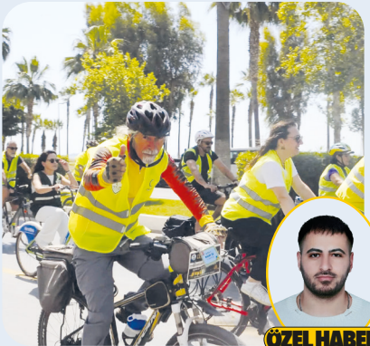
ÖZEL HABER KADRI DUMAN

Mersin'de bu yıl 12'ncisi düzenlenen Yeşilay Bisiklet Turu, binlerce kişinin katılımıyla sağlıklı yaşam ve bağımlılıkla mücadelede dikkat çekti; protokol ve halk, omuz omuza pedal çevirerek farkındalık oluşturdu. Yeşilay'ın her yıl geleneksel olarak düzenlediği ve bu yıl 12'ncisi gerçekleştirilen Yeşilay Bisiklet Turu, Mersin'de büyük bir katılım ve coşkuyla bir atmosferde yapıldı. Türkiye genelinde 81 ilde eş zamanlı düzenlenen bu anlamlı etkinlikte, sağlıklı yaşamın ve bağımlılıkla mücadelenin önemi bir kez daha vurgulandı.