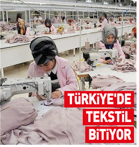
TÜRKİYE'DE TEKSTİL BİTİYOR

Yükselen maliyetler karşısında yatırımını Ortadoğu ülkelerine çekmek zorunda kalan üreticiler sektör çalışanlarını işsiz bırakırken, Türkiye'de üretim yapmaya devam eden üreticilerin ise ayakta durmakta