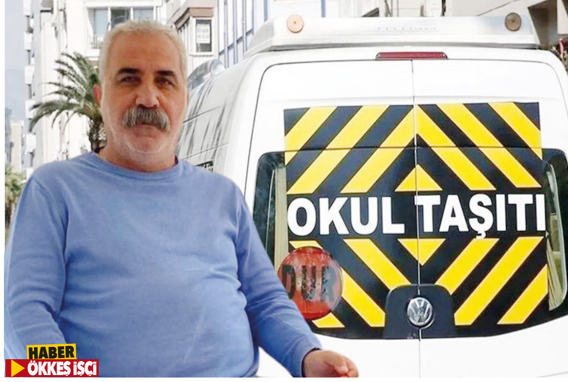
HABER ÖKKE İŞÇİ

Mersin'de yeni eğitim öğretim yılı öncesi okul servis ücretleriyle ilgili dikkat çeken gelişmeler yaşanıyor. Artan akaryakıt, bakım ve personel maliyetleri nedeniyle servis ücretlerine yüzde 30 ila 35 arasında zam yapılması gündemde. Henüz resmi tarifeler açıklanmasa da, sektör temsilcileri zam kararının kaçınılmaz olduğunu belirtiyor. Veliler ise açıklanacak yeni rakamları merakla bekliyor.